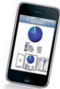
QlikView para iPhone

Descarga gratuita y de plena funcionalidad. Experiencia “ver para creer”